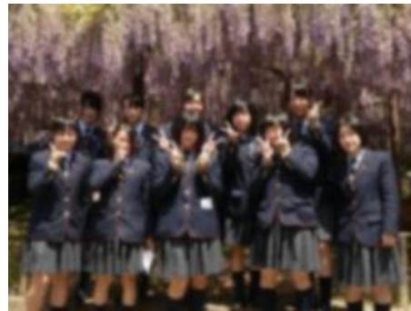
北方文化博物館の藤棚とともに