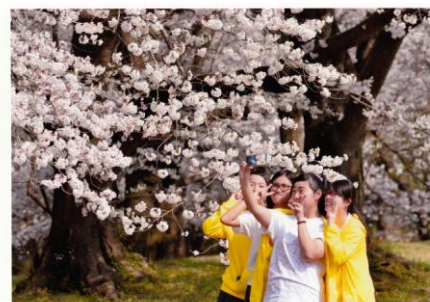
愛龍フォトコンテスト 最優秀作品 「クラスメイト」