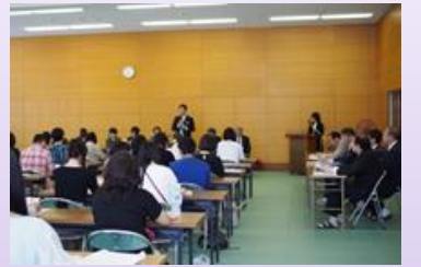
↑母師会総会 ↓公開授業

これからも、学校の取り組みや生徒たちの活動が生徒たちの成長に寄与し、保護者の皆様に伝わるよう教職員一同努めていきますので、保護者の皆様の積極的参加をよろしくお願いいたします。