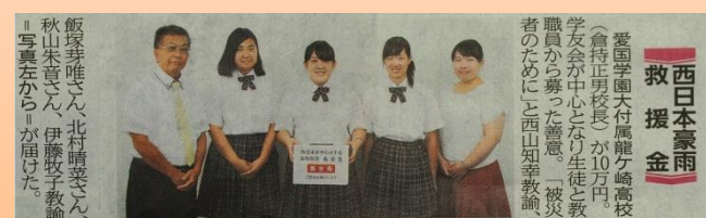
沢山の御協力ありがとうございました。

7月18日(水)、19日(木)の2日間、学友会自治委員を中心に、西日本豪雨災害に対する義援金募金活動を行いました。生徒、及び、教職員より6万円の義援金が集まりました。愛国学園の親切貯金4万円を加えた10万円を茨城新聞社を通して、被災者の方々へお届けしました。また、7月28日の茨城新聞に掲載していただきました。